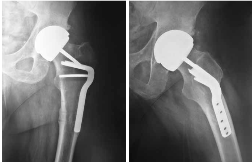
▲ Figura 2. Controles radiográficos posoperatorios. Nótese el contacto del vástago con el clavo que varizó ligeramente el componente femoral al final de su impactación.

gión metafisaria o tal vez por la necesidad de realizar una nueva osteotomía asociada al implante femoral. En algunos casos, el material de osteosíntesis, como en el paciente presentado o en casos de fracturas de fémur (tornillos, placas, clavos retrógrados largos, etc.) dificulta aún más el procedimiento. Como consecuencia, la preparación del canal femoral puede ser un reto y se pueden esperar tasas de complicaciones más altas (fracturas intraoperatorias, falsas vías, inestabilidad posoperatoria, etc.). 1