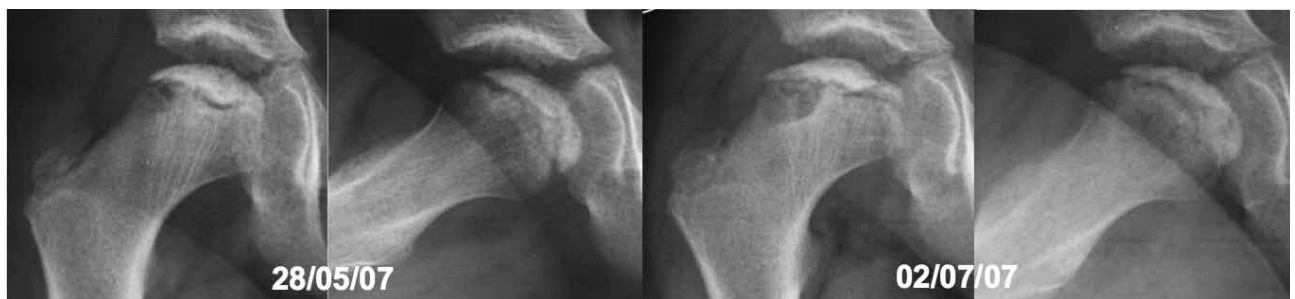
Figura 2. Radiografías que muestran el comienzo de la recurrencia de la enfermedad de Legg-Perthes-Calvé. Se aprecia un pilar lateral Herring B.

Recibido el 4-11-2014. Aceptado luego de la evaluación el 26-12-2014.