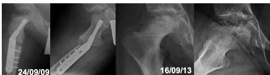
Figura 6. Derecha: imagen posoperatoria, tras osteotomía valguizante de fémur proximal con osteosíntesis con un tornillo-placa de 140°. Izquierda: último control radiológico en el que se observa una articulación coxofemoral de tipo 4 dentro de la clasificación de Stulberg, con una cadera en valgo.