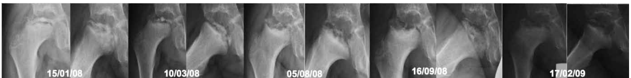
Figura 5. Evolución radiológica en la que se aprecia necrosis de la cabeza femoral que implica la fisis, con subluxación evidente.