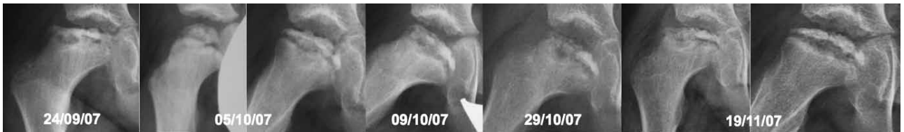
Figura 4. Evolución radiológica desfavorable en la recurrencia de la enfermedad de Legg-Perthes-Calvé (fragmentación del núcleo, signo de Gage, horizontalización de la fisis, subluxación).

La enfermedad de Legg-Perthes-Calvé (LPC) es una patología muy frecuente cuya recurrencia es algo excepcional. Se trata de una enfermedad idiopática de la cadera que produce una necrosis isquémica de la cabeza femoral en crecimiento, y provoca cojera en niños de entre 3 y 9 años. La tasa de recurrencia oscila entre el 0,14% 1 y el 0,25%. 2