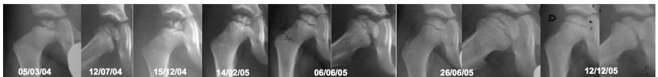
Figura 1. Evolución radiológica del primer episodio de la enfermedad de Legg-Perthes-Calvé, clasificada como Herring A y Stulberg de tipo 1 después del tratamiento.

Tras 4 meses de empeoramiento clínico y radiológico (fragmentación del núcleo, signo de Gage, horizontalización de la fisis, subluxación [Fig. 4]), se decide la hospitalización para tratamiento ortopédico con tracción blanda