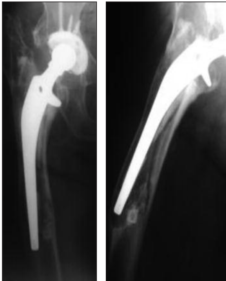
Figura 2. Fractura periprotésica de cadera tipo B3. En la radiografía de perfil (A2), se observa el déficit de capital óseo en el fémur proximal.

cionadas a medida, debido a la importante pérdida de capital óseo y la edad avanzada de los pacientes; y una de fémur total en un paciente donde el déficit se extendía tanto a distal que el fémur remanente no era suficiente como para aceptar el tallo protésico, además de tener una importante afección artrósica de la rodilla. Cuatro tallos largos cementados asociados a injerto óseo molido e impactado en 3 y en 2 con aloinjerto estructural en forma de tablas junto a lazadas de alambre intentando devolver a estos el déficit óseo, mientras que las tablas fueron colocadas como refuerzo en las zonas más debilitadas de las corticales (Fig. 3); finalmente, en los dos casos restantes, se utilizaron 2 prótesis de fijación distal asociadas a lazadas de alambre, dado que las características de estos últimos 2 fémures en su zona distal aceptaban la colocación de estos tallos (Fig. 4).