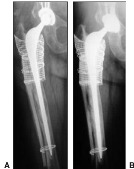
Figura 3. A. Radiografía del posoperatorio inmediato de un paciente en el que se utilizó un tallo largo cementado, aloinjerto óseo impactado, malla metálica y una tabla cortical de aloinjerto. B. Radiografía a los tres años de la cirugía. Se observa la curación de la fractura, la reabsorción parcial de la tabla y la integración del injerto molido.

En los 9 casos de fracturas B2, se observó la curación y la remodelación de la fractura. El tiempo promedio de internación fue de 7 días (rango 6-14). El Harris Hip Score posoperatorio promedio fue de 78 puntos (rango