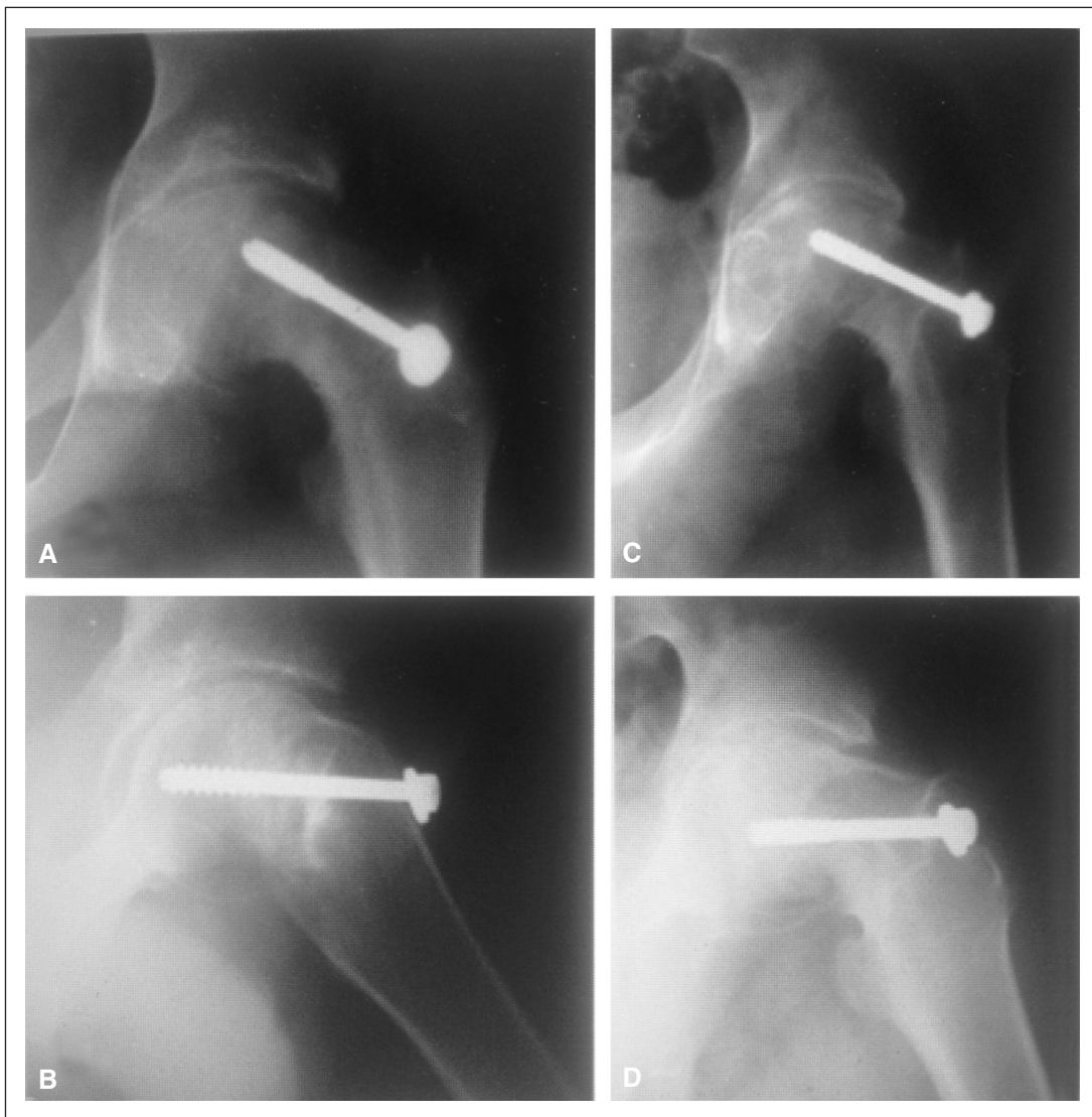
Figura 3. A y B. Radiografías de frente y de perfil, posoperatorio inmediato de un deslizamiento crónico grave fijado in situ. C y D. Radiografías del mismo paciente a los 48 meses de seguimiento. Se observa un rápido deterioro radiográfico. En las radiografías A y B, el grado de Tonnis es 2 y, en las radiografías C y D, 3 con pseudoquistes epifisarios, deformidad y pinzamiento grave. El paciente tuvo una condrólisis como complicación.