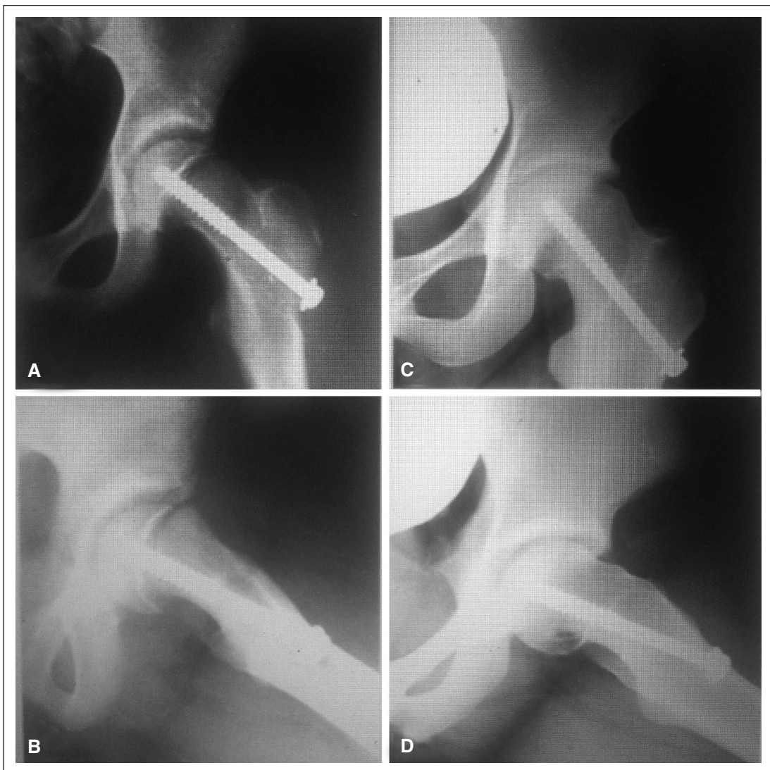
Figura 2. A y B. Radiografías de frente y de perfil, posoperatorio inmediato de un deslizamiento de 40^\circ fijado in situ. C y D. Radiografías del mismo paciente a los 65 meses de seguimiento. Se observa un ángulo de Southwick de 28^\circ en el perfil. La remodelación estuvo presente en 12^\circ . En las radiografías A y B, el grado de Tonnis es 1 y, en las radiografías C y D, es de 2, por lo que también hubo deterioro.

Se sabe que incluso los deslizamientos leves pueden tener consecuencias a largo plazo, por defectos mecánicos en la articulación de la cadera, y que la gravedad del deslizamiento influye en los malos resultados. 5-13,17 El daño temprano ocasionado por el choque entre la prominencia de la metáfisis femoral deformada y el cartílago articular del acetábulo es una realidad confirmada por varios trabajos. 18-22 Sin embargo, la fijación in situ de los deslizamientos >30^\circ sigue siendo el método preferido por la ma-