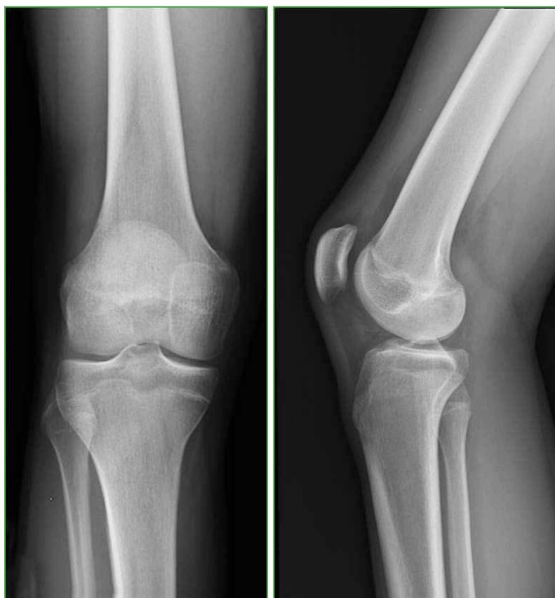
Figura 1. Radiografías de rodilla derecha de frente y de perfil, normales.

En las radiografías, no se identifican lesiones aparentes (Figura 1). En la resonancia magnética, se puede observar un importante edema en el cóndilo femoral externo, con compromiso de los sectores metafisario y epifisario, sin lesión del cartílago de crecimiento, visible preferentemente en las secuencias sensibles a los líquidos y con supresión grasa (STIR) (Figura 2A).