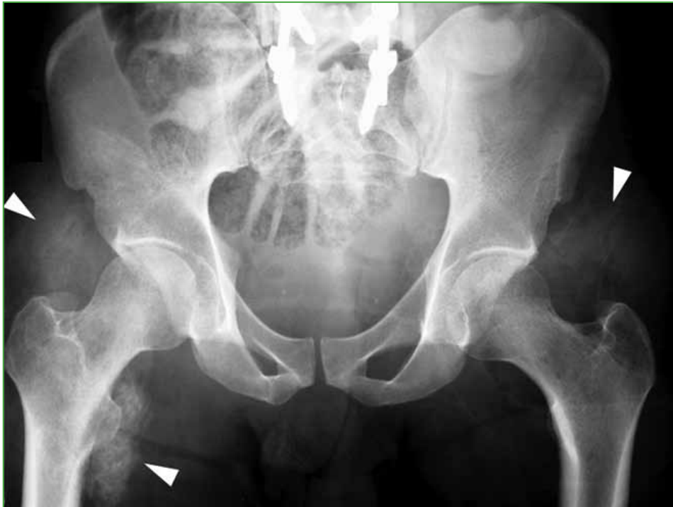
Figura 1. Radiografía de pelvis, de frente. Aumento de la densidad en la región glútea izquierda y calcificaciones en relación con el trocánter menor derecho.

En las radiografías de frente, de ambas caderas, se observa un aumento de la densidad en las regiones glúteas derecha e izquierda. También se reconocen calcificaciones en relación con el trocánter menor derecho ( Figura 1 ).