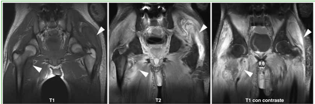
Figura 2. Resonancia magnética de pelvis, con medio de contraste. En la secuencia T1, se observan imágenes de baja señal en el trocánter menor derecho, leve refuerzo poscontraste. Hay un discreto edema en las secuencias T2. En la región glútea izquierda, la señal en la secuencia T1 es intermedia y, en la secuencia T2, es alta, con marcado refuerzo del medio de contraste.

La resonancia magnética con medio de contraste muestra, en las secuencias, pequeñas imágenes de baja señal en el trocánter menor derecho, leve refuerzo poscontraste. Hay un discreto edema en las secuencias T2. En la región glútea izquierda, la señal en la secuencia T1 es intermedia y, en la secuencia T2, es alta, con marcado refuerzo del medio de contraste (Figura 2). La tomografía computarizada revela calcificaciones maduras en relación con el músculo psoas ilíaco derecho y pequeñas calcificaciones periféricas en la región glútea izquierda (Figura 3).