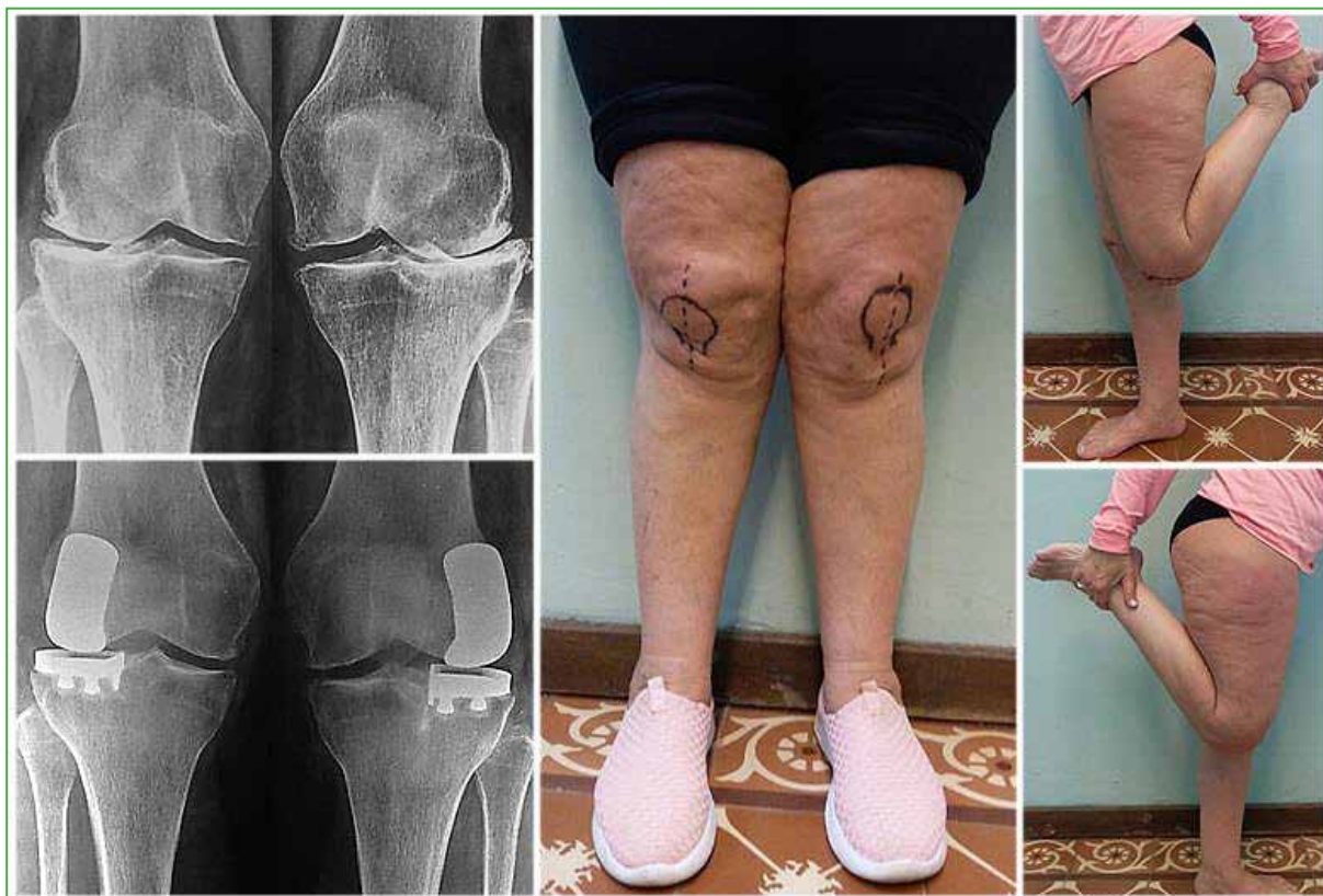
Figura 4. Paciente de 62 años con genu valgo bilateral tratado con prótesis unicompartmental de rodilla lateral bilateral en un tiempo, con 7 años de seguimiento. Correcta alineación de los componentes de la prótesis, con restauración del valgo primitivo y función completa de las rodillas.