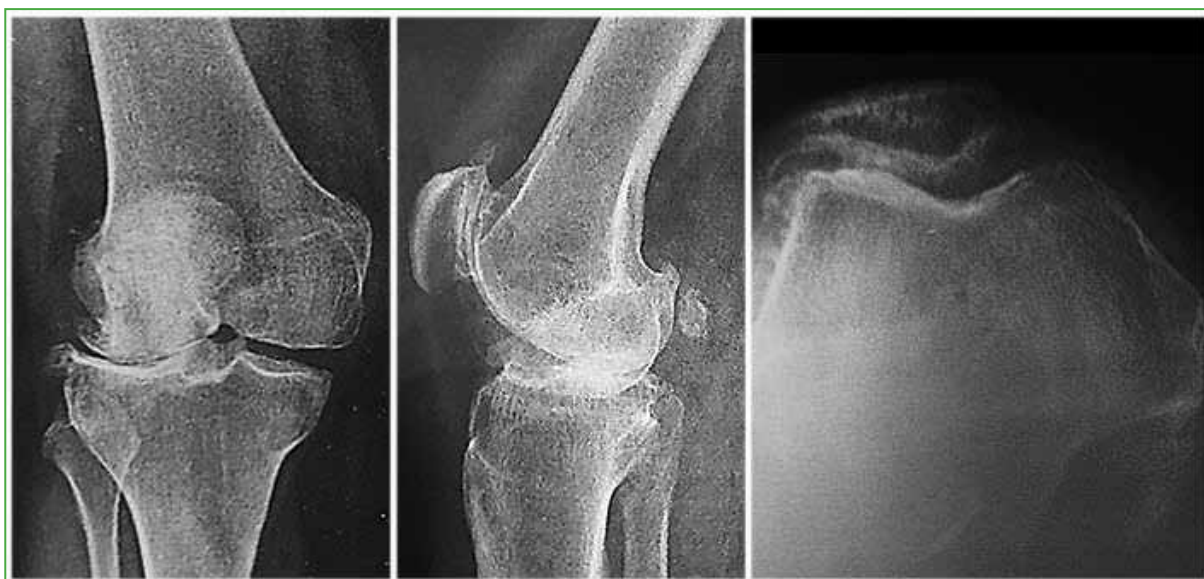
Figura 1. Radiografías de rodilla derecha preoperatorias. Genu valgo artrósico grado 4 de Kellgren y Lawrence con artrosis femororrotuliana.

Se midió el eje femorotibial con un goniómetro antes de la operación y después de ella. Se cuantificó el grado de artrosis en el compartimento externo y la existencia de progresión en el compartimento contralateral según la escala de Kellgren y Lawrence. Las evaluaciones estuvieron a cargo de uno de los autores que no intervino en la cirugía.