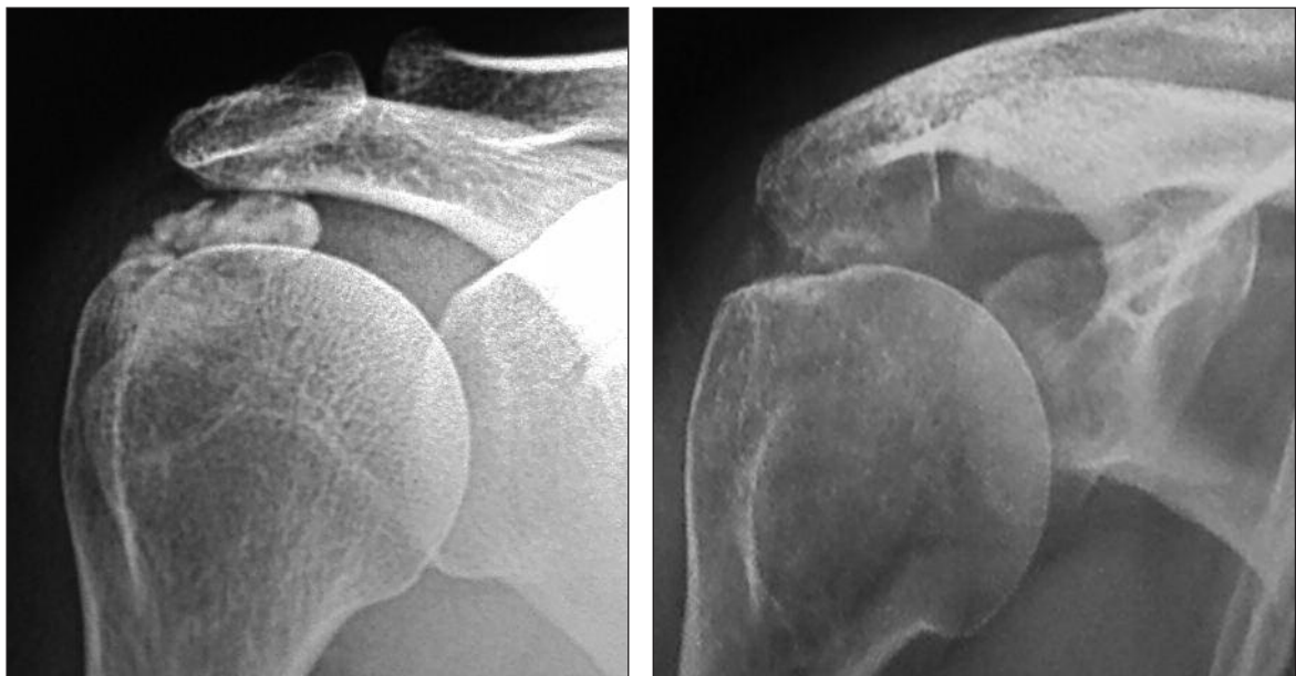
Figura 2. Desaparición parcial de una calcificación estadio II de Gärtner grande en una paciente en la que se produjo una remisión completa de la sintomatología.

a valores de 1 o 0 (valor en la escala analógica visual 2 y 3) o con recaídas ocasionales. Desde el punto de vista radiográfico, esta categoría incluye casos sin cambios en las imágenes y a pacientes con desapariciones subtotalet de la calcificación o cambios evidentes en su densidad. A este grupo corresponden 4 de los 44 casos (9%).